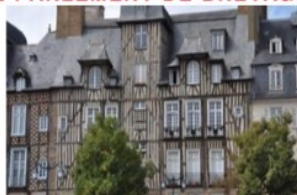
LA PLACE DES LICES