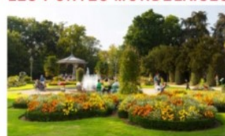
PARC DU THABOR