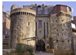
LES PORTES MORDELAISES