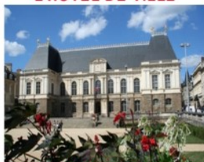
LE PARLEMENT DE BRETAGNE